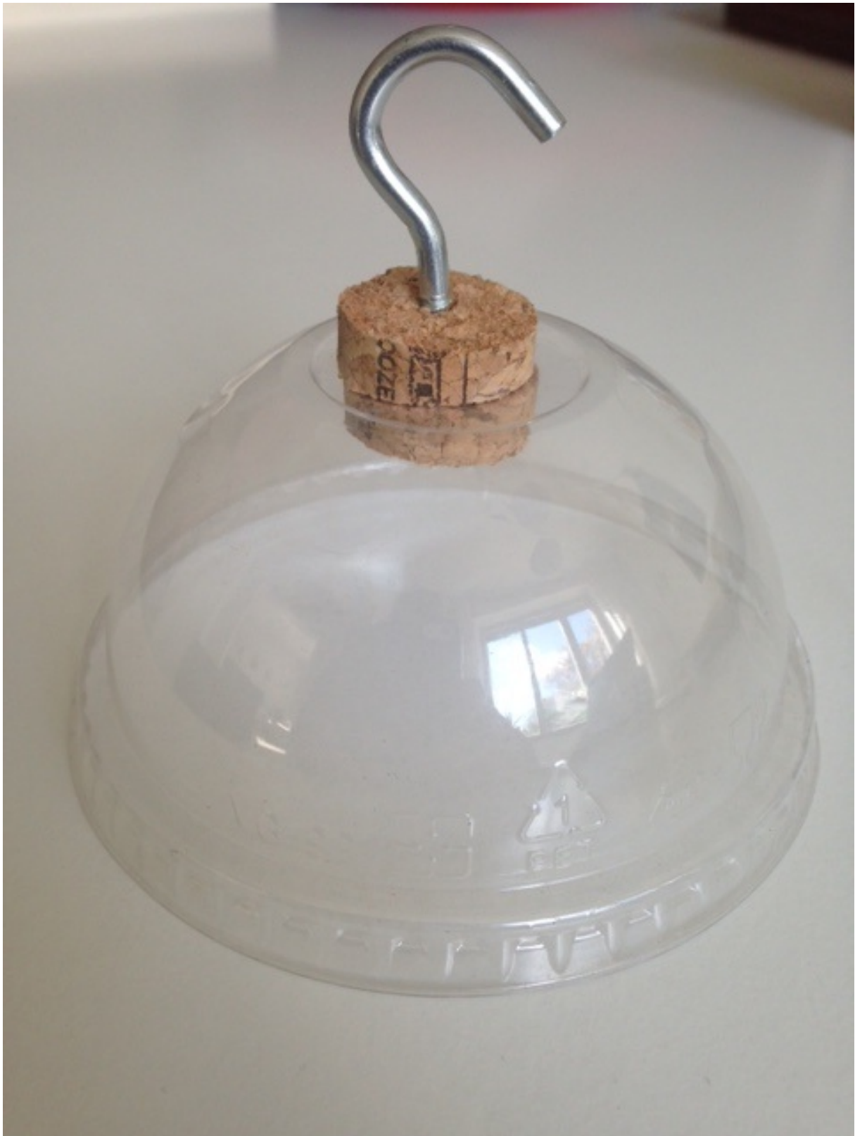
Foto van VAL met ophanging deksel en hele val